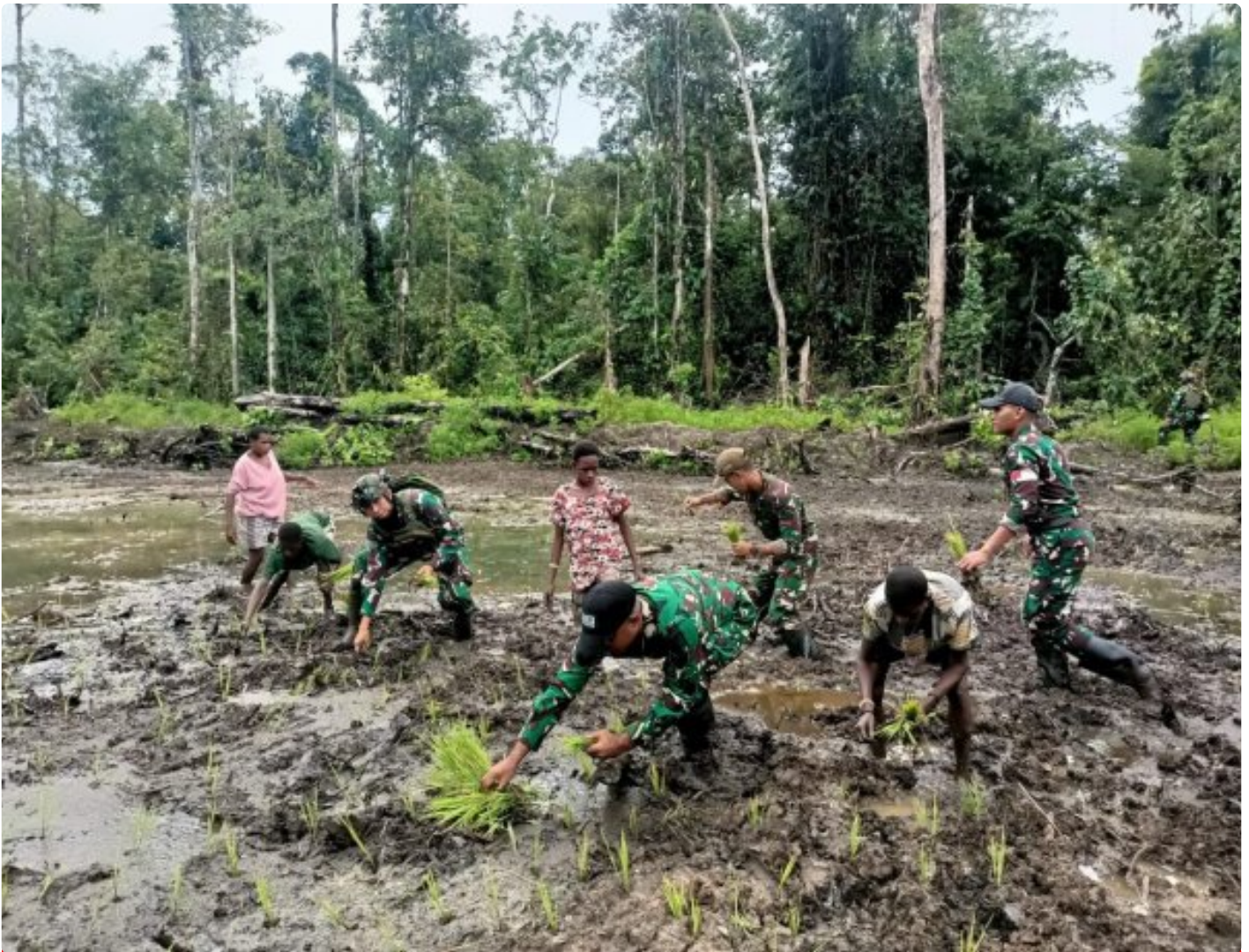
Foto: Satgas Pamtas Mobile RI-PNG Yonif 503/Mayangkara menggagas program ketahanan pangan yang melibatkan langsung warga Kampung Mumugu, Distrik Krepkuri, Kabupaten Nduga, Selasa (07/01/2025).

NDUGA- Dalam upaya membangun kesejahteraan masyarakat di wilayah