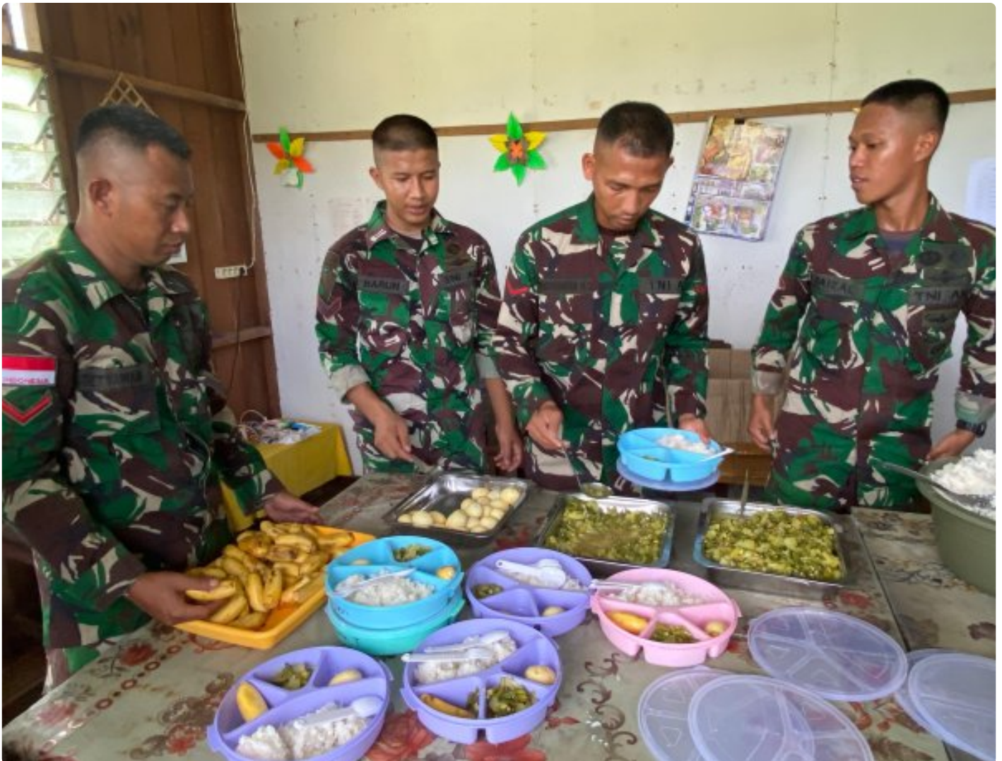
Foto: Dedikasi Satgas Pamtas Mobile RI-PNG Yonif 503/Mayangkara dalam mendukung program makan bergizi gratis pemerintah mendapat apresiasi tinggi dari masyarakat Distrik Krepkuri, Kabupaten Nduga, Papua, di sekolah rimba, Rabu (29/01/2025).